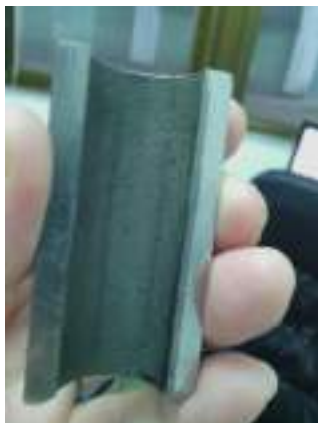
Slika 4. Tačkasta korozija na unutrašnjoj površini cijevi

Vizuelno je zapaženo da zaprljanost cijevi nije ravnomjerna, a nakon bajcovanja je vidljiva tačkasta korozija, slika 4.