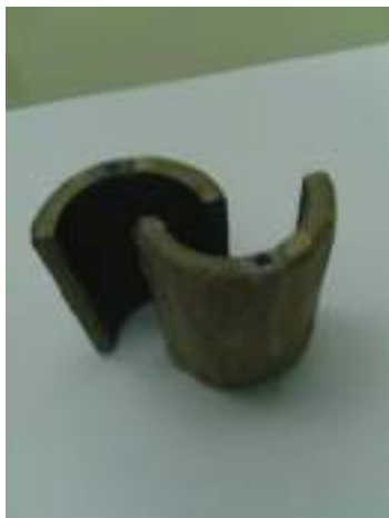
Slika 3. Poluprstenovi cijevi zaštićeni voskom

Poluprstenovi sa formiranom navrtkom su sušeni 60 minuta u eksikatoru sa žarenim kalcijum hloridom, a zatim mjereni na analitičkoj vagi Mettler AE163 Dual range balance 0-30g (readability 0,01mg), 0-160g (readability 0,1mg). Spoljašna strana poluprstenova, navrtke i vijci sve do izolacije bakarnog provodnika, je zaštićena voskom (slika 3).